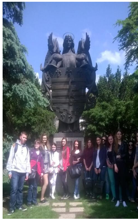
Najstarší erb mesta v Európe