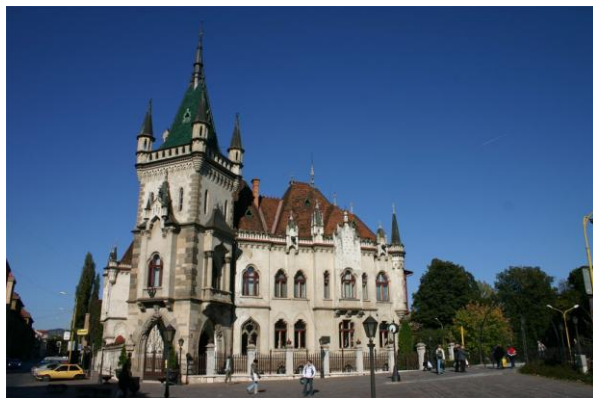
Kultúrna pamiatka Jakobov palác v Košiciach