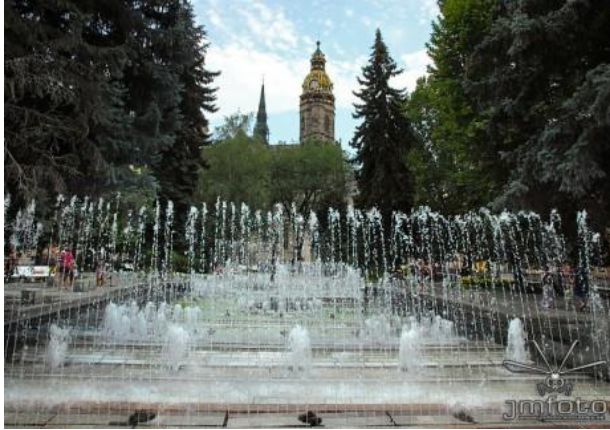
Spievajúca fontána a zvonkohra